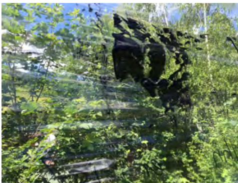
„sledi_Spuren/i.M. F.H.“, 2016, Installation, 40 x ca. 250 cm, Acryl auf Kunststoffolie, Gedichte von Fabjan Hafner